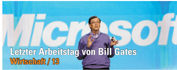
Letzter Arbeitstag von Bill Gates Wirtschaft / 13

NTB-Studenten haben in St. Gallen selbst gebaute Roboter vorgestellt Wirtschaft / 14