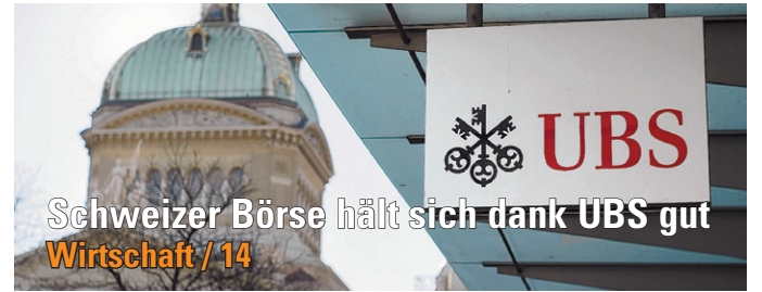
Schweizer Börse hält sich dank UBS gut Wirtschaft / 14