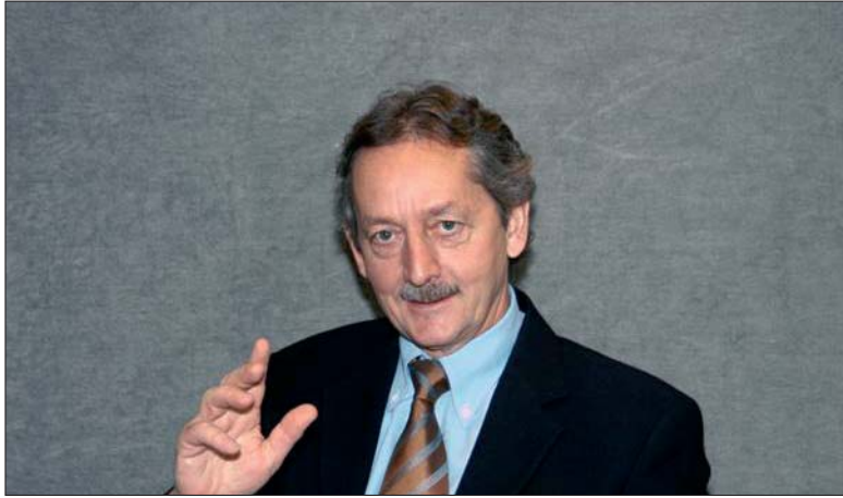
«Liechtenstein hat viel Kompetenz im Finanzsektor»

Verhältnisse angepasst haben. Die ganze Branche steckt in einer Lernphase und es sind noch einige Entwicklungen zu erwarten. Daneben muss berücksichtigt werden, dass sich viele NGOs und öffentliche Institutionen im Kleinfinance-Bereich engagieren. Diese haben oft gar nicht das Ziel, Microfinance rentabel zu betreiben.»