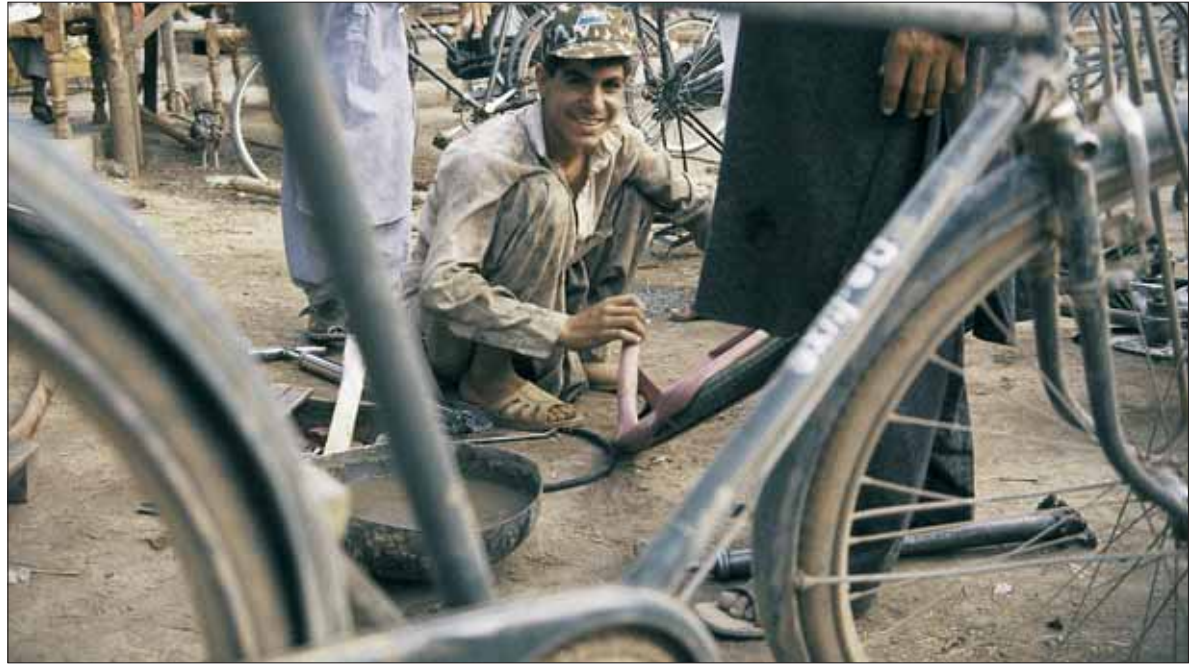
Kleinunternehmer dank Microfinance

Für die Nachhaltigkeit des eigenen Betriebs und seiner positiven Wirkung für die Kunden ist eine solche Professionalisierung unumgänglich. Die Microfinance-Institute sehen diese Notwendig-